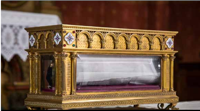
La Sainte Tunique du Christ est exposée deux fois par siècle. Elle est conservée le reste du temps dans ce reliquaire.