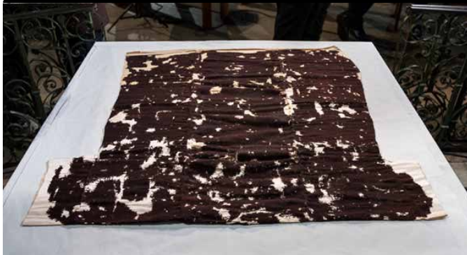
La Sainte Tunique a été très abîmée au cours de sa longue histoire, en particulier lors de la Révolution où elle a été découpée pour être sauvegardée.