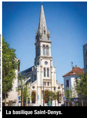
La basilique Saint-Denis.

L'histoire de la Tunique d'Argenteuil est